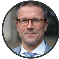
Uwe Schneidewind Oberbürgermeister von Wuppertal