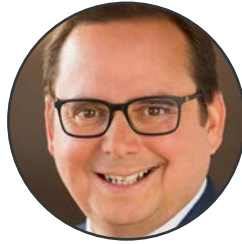
Thomas Kufen Oberbürgermeister der Stadt Essen